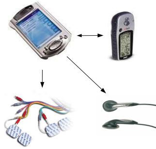
Abb. 1: Komponenten des Systems

Ein Navigationssystem muß neben der Funktionalität auch noch viele weitere Anforderungen erfüllen. Kriterien für ein benutzbares NS sind neben Genauigkeit und Funktionalität vor allem auch Größe und Gewicht.